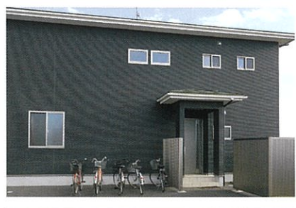
外国人材が暮らす宿舎。生活環境も整っている

技能実習生の場合、日本語レベルがまだ低い方が多いと思います。コミュニケーションを取る際に工夫されていること