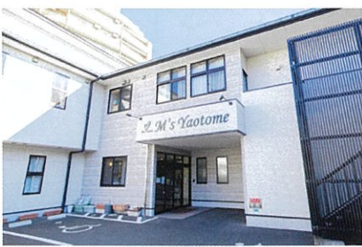
複合介護施設のエムズ八乙女