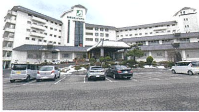
秋保温泉にある『秋保グランドホテル』。『ホテル瑞鳳』までは車で約1分の距離