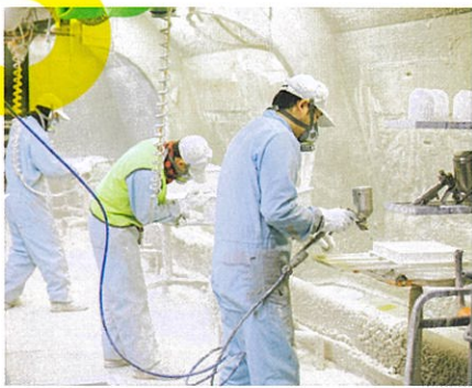
空調用グリルの塗装を行う技能実習生たち

業種／製造業 外国人材雇用状況/ 技 人 国：インド1名 技能実習生：インドネシア12名 住所／宮城県刈田郡蔵王町 矢附字川原1-2 電話／0224-22-7780 URL／https://www.e-astem.jp